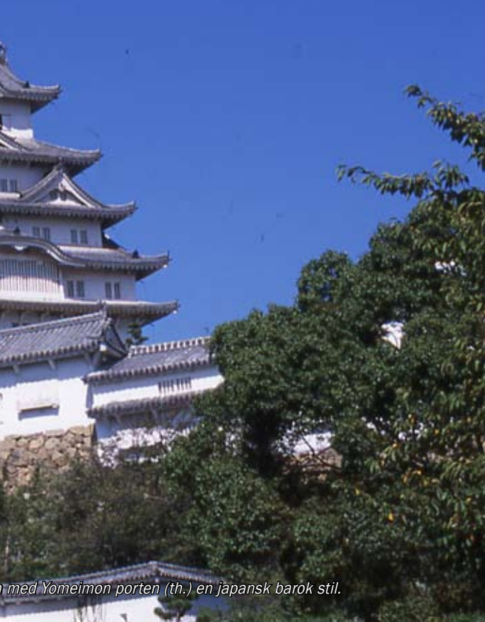
med Yomeimon porten (th.) en japansk barok stil.