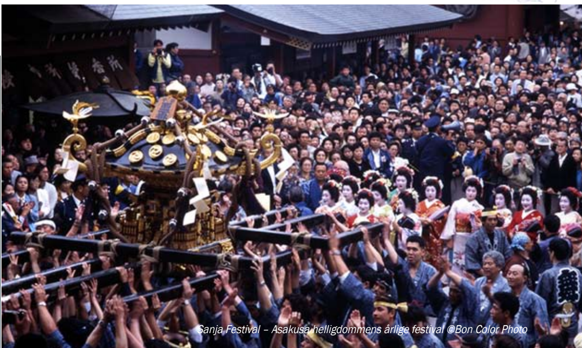
Sanja Festival - Asakusa helligdommens årlige festival

Mekanisk dukke, der serverer te. Dukken kommer med en kop te, og når du har drukket den og anbragt koppen i dens hænder, går den tilbage igen.