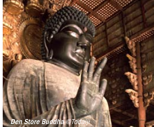
Den Store Buddha ©Todaiji