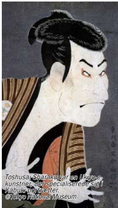
Toshiyuki Sharaku var en Ukiyo-e kunstner, der specialiserede sig i Kabuki portrætter. ©Tokyo National Museum