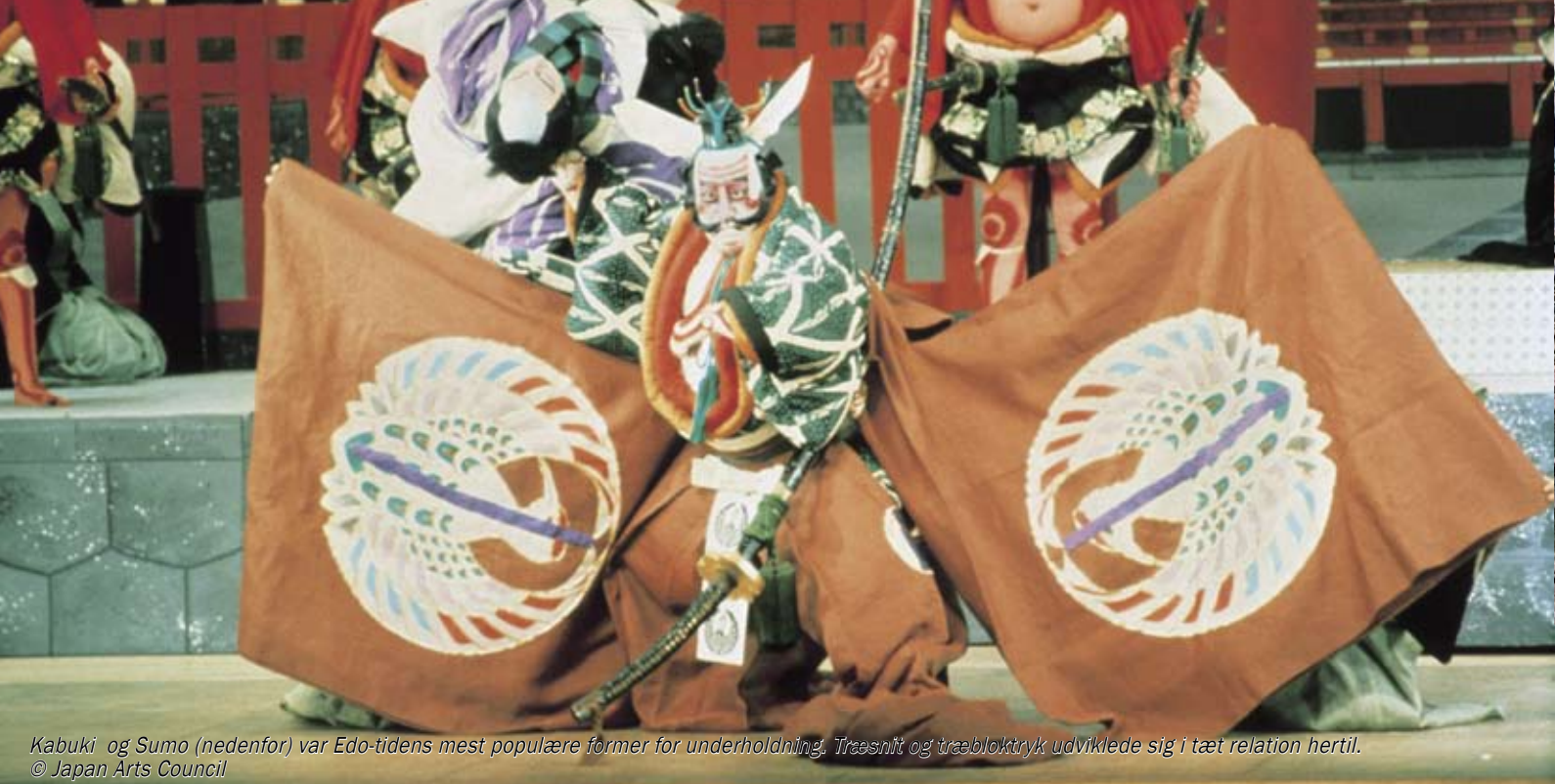
Kabuki og Sumo (nedenfor) var Edo-tidens mest populære former for underholdning. Træsnit og træbloktryk udviklede sig i tæt relation hertil.