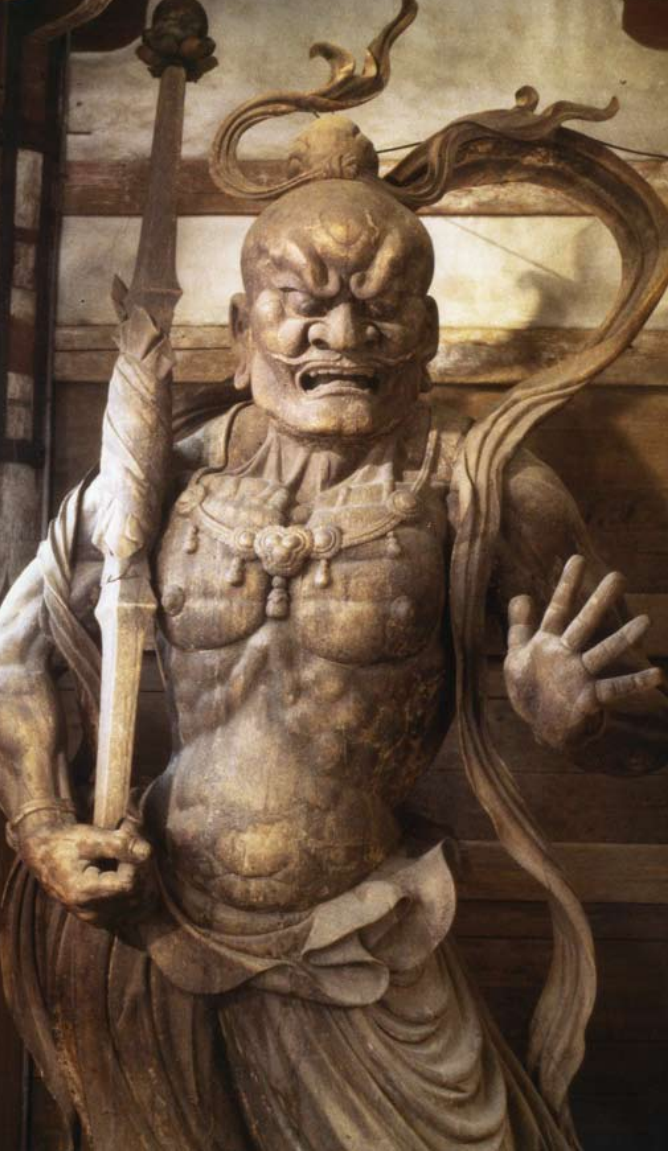
Mens Kyoto var aristokraternes metropol, byggede samuraiene deres magtcenter i det østlige Japan. Kamakura var det første hovedsæde, og her kan man stadig se træstatuer med stærke udtryk, der passede til samuraiklassens temperament og ritualer som Yabusame (bueskydning til hest). ©Todajji Foto venligst udlånt af: Nara Prefecture Board of Education