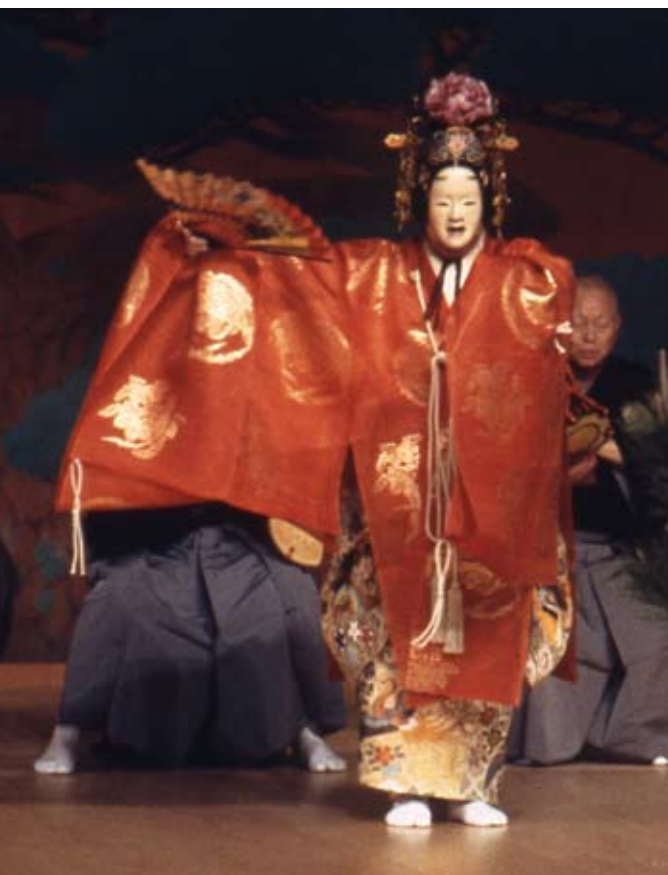
Teaterformen Noh stod under samurai generalers protektion. © National Noh Theatre