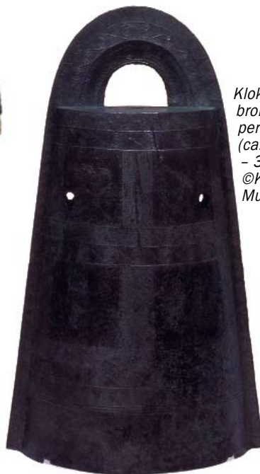
Klokke af japansk bronze fra Yayoi-perioden (ca. 800 f. Kr. - 300 e. Kr.)