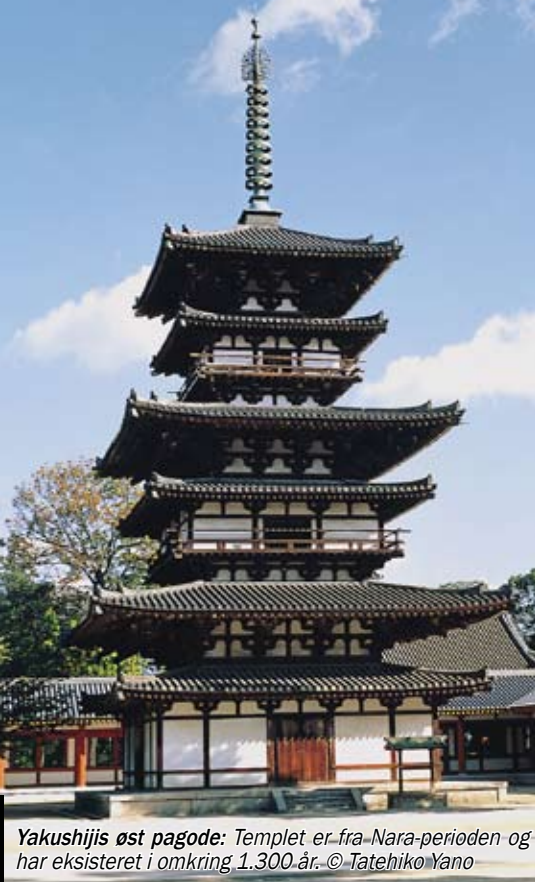
Yakushijis øst pagode: Templet er fra Nara-perioden og har eksisteret i omkring 1.300 år.