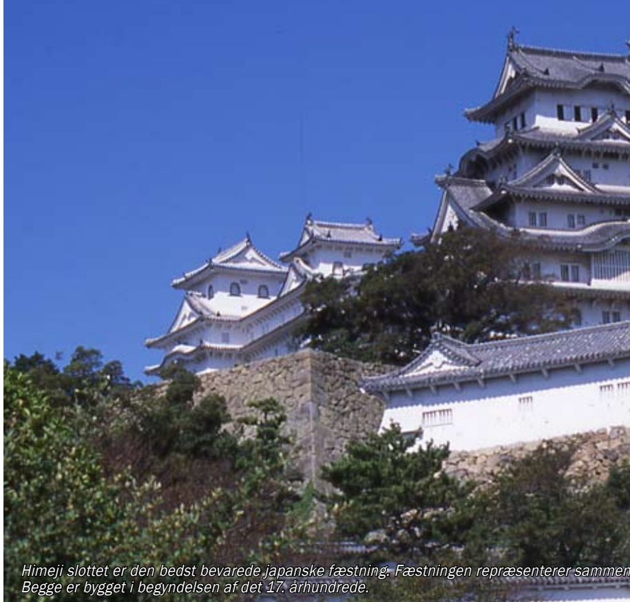
Himeji slottet er den bedst bevarede japanske fæstning. Fæstningen repræsenterer sammen med Kyoto den bedste bevarede arkitektur fra Edo-tiden. Begge er bygget i begyndelsen af det 17. århundrede.