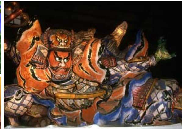
Nebuta Festival i Aomori

Forskellige festivaler, som vi kender i dag, antog deres nuværende form i Edo-perioden. Det gælder bla. Pigernes Dag med Hina-dukker den 3. marts (ovenfor) og Drengenes Dag med karpevimpler den 5. maj (nedenfor.)