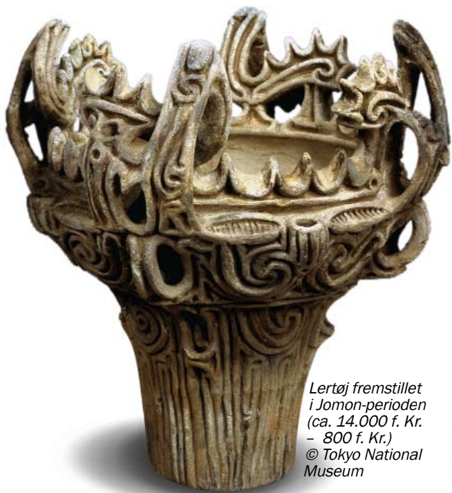
Lertøj fremstillet i Jomon-perioden (ca. 14.000 f. Kr. - 800 f. Kr.)