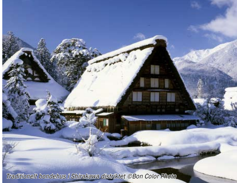
Traditionelt bondehus i Shirakawa distriktet

Turismen blomstrede ligeledes - især pilgrimsrejser til Ise helligdommen var populære. Rejsebøger blev bestsellers, og langs ruten kunne man købe alle mulige souvenirs.