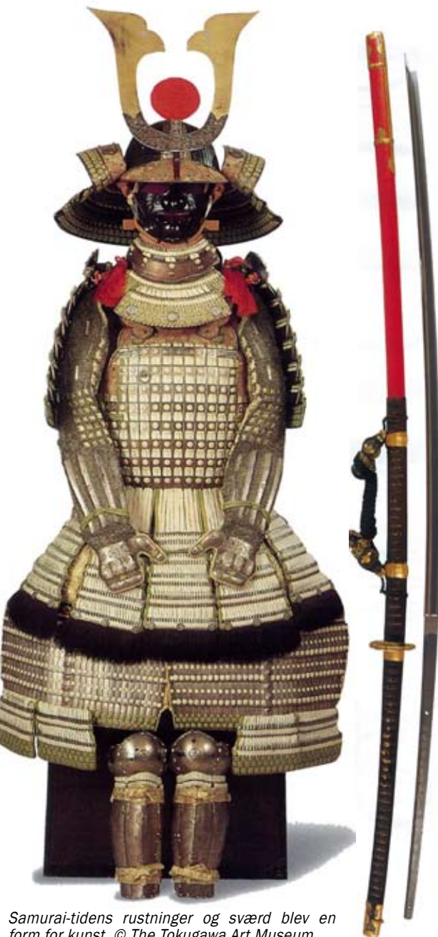
Samurai-tidens rustninger og sværd blev en form for kunst.

Ninjaer optræder mest i fantasi-historier og i film, men der er mulighed for at opleve ninjaer på mere realistisk vis bestemte steder i Japan.