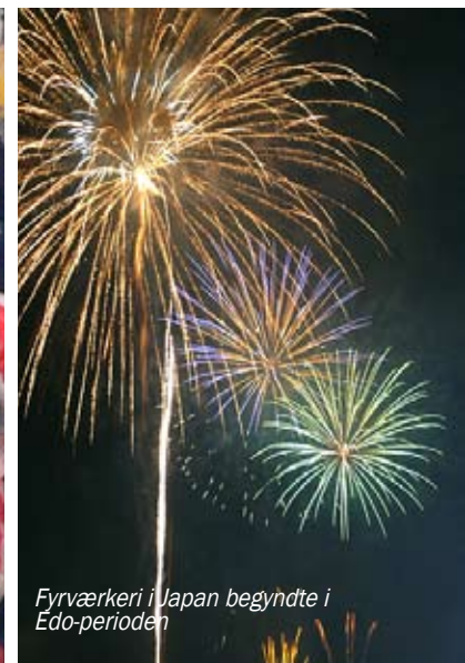
Fyrværkeri i Japan begyndte i Edo-perioden