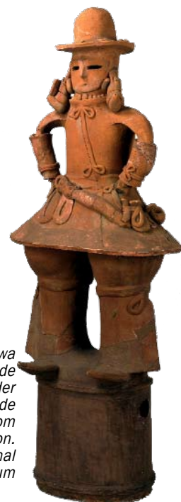
Haniwa - hule, uglaserede lerskulpturer, der blev lagt på de store gravhøje som dekoration.