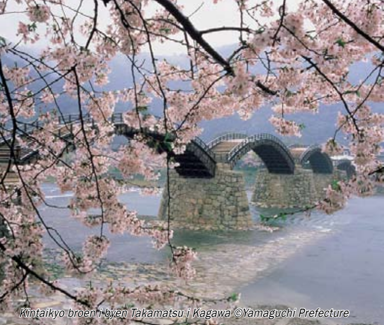
Kintaikyo broen i byen Takamatsu i Kagawa