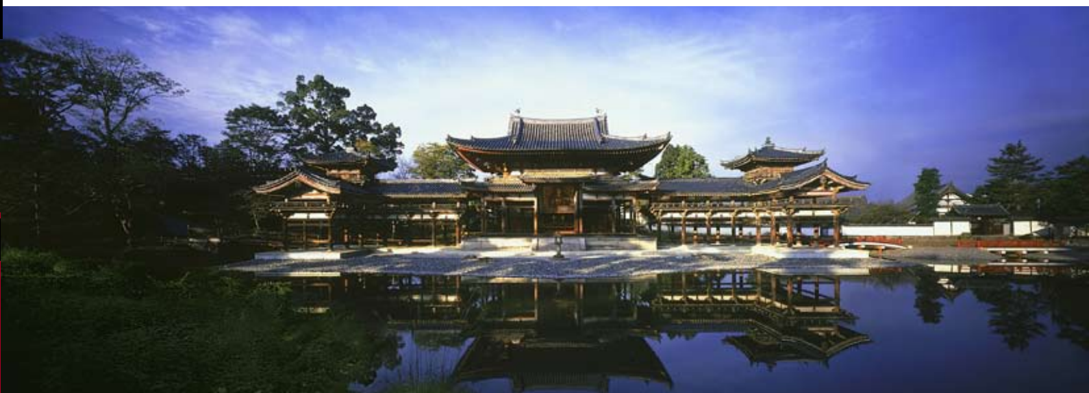
Byodoin, bygget i 1053, forestiller Amitabha paradiset, som enhver dengang håbede på at blive genfødt i efter et hårdt liv i denne verden.