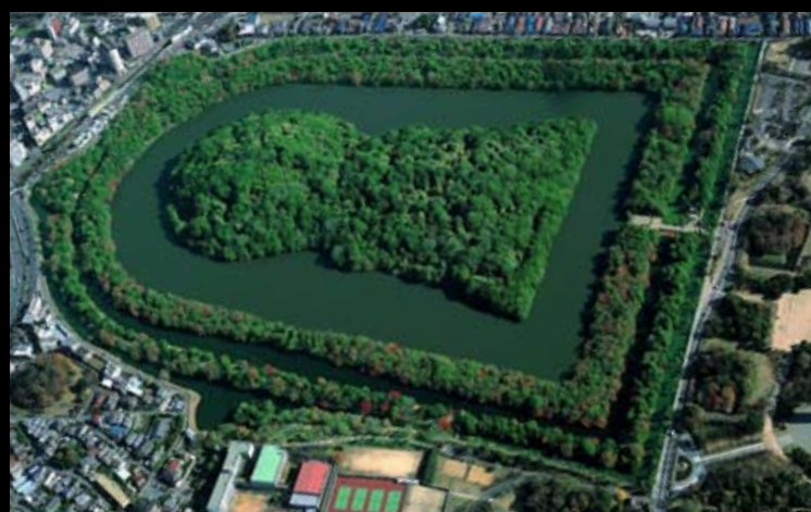
Den største kofun blev bygget i nutidens Sakai for den 16. Kejser Nin'toku.

Senest i det 5. århundrede blev Japan en samlet stat med hovedstad i Kansai området, og de første kejsere blev begravet i gigantiske gravhøje.