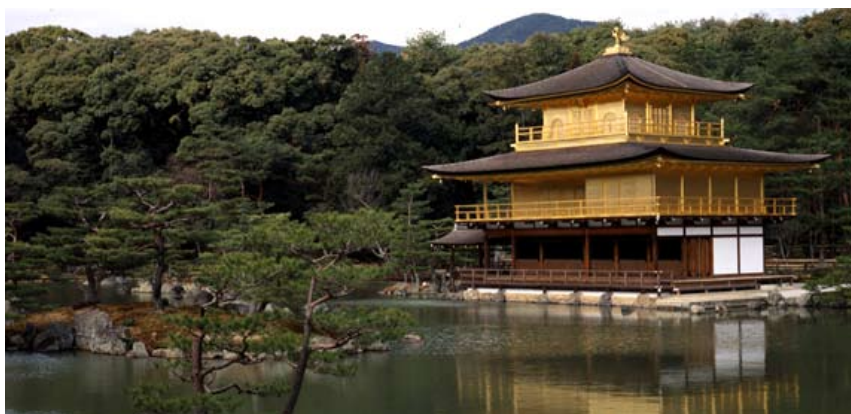
Zen-templer, som Kinkakuji, udviklede japansk havekunst på deres egne måder.

I løbet af denne periode ekspanderede japanerne relationerne til andre asiatiske lande, og i 1543 kom de første europæere til Japan.