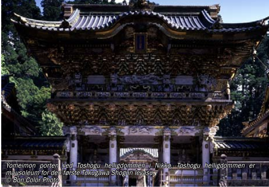
Yomeimon porten ved Toshogu helligdommen i Nikko. Toshogu helligdommen er mausoleum for den første Tokugawa Shogun Ieyasu.